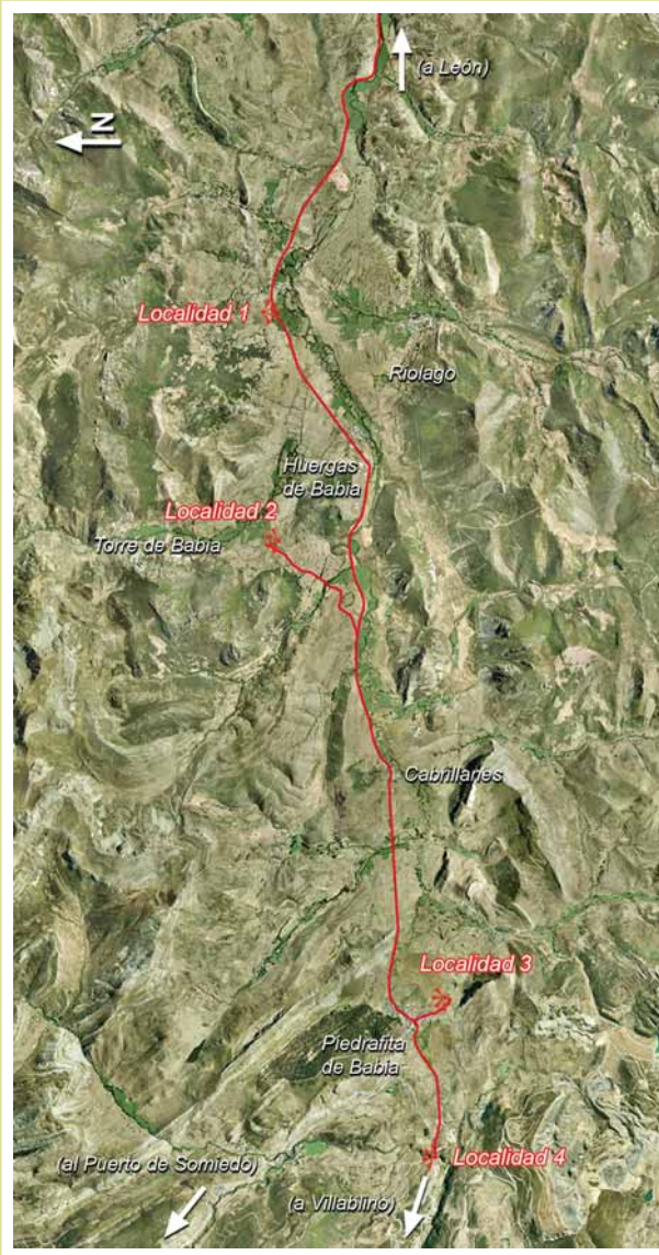
Ubicación de las localidades del itinerario en la comarca de La Babia.